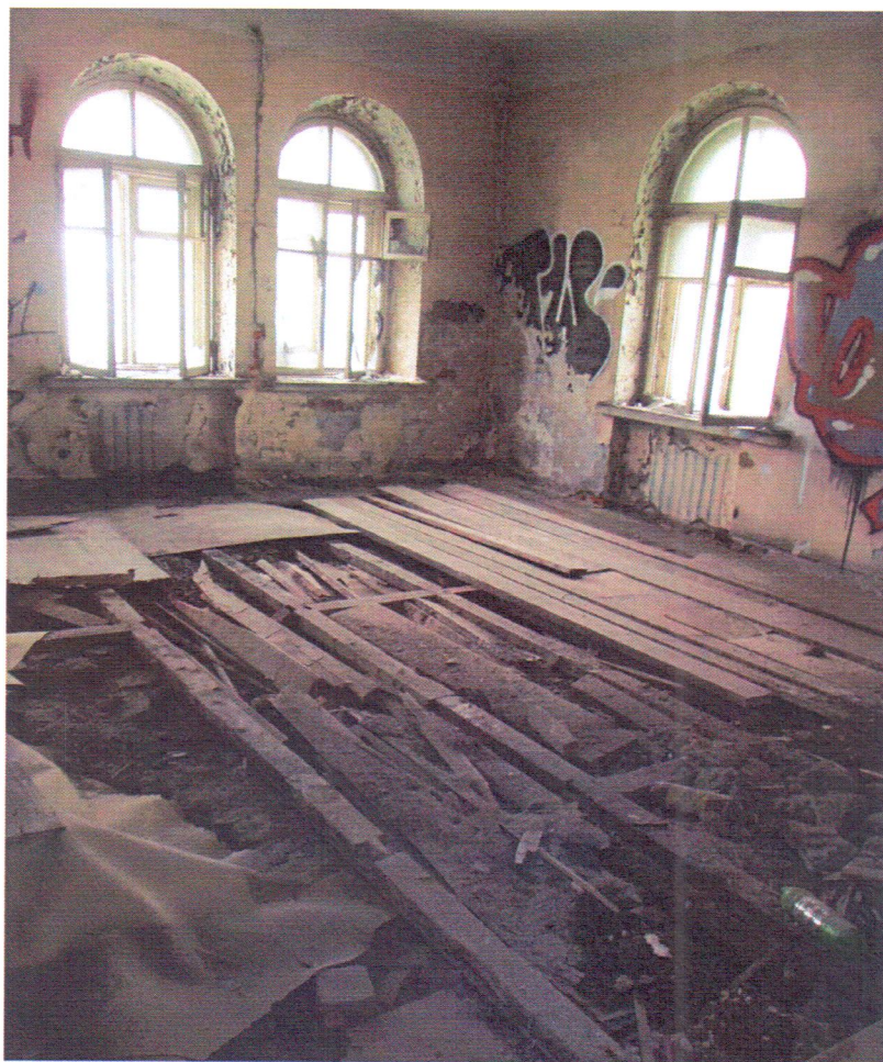
Фото 4. Помещения второго этажа