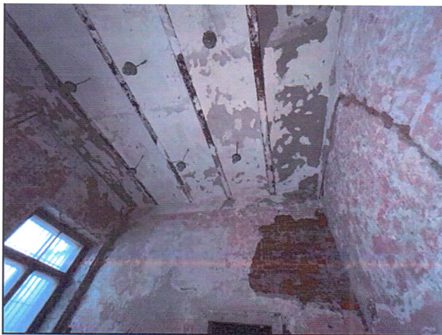
Фото 5. Помещения первого этажа