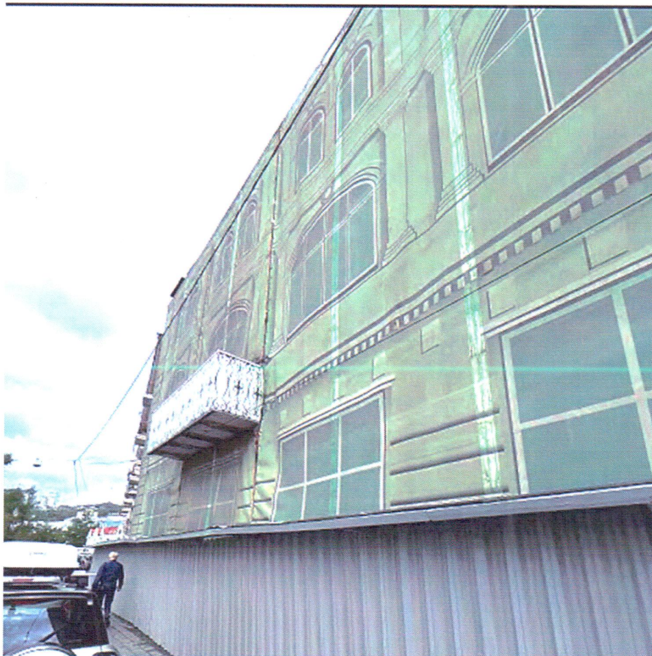
Фото 1 Главный южный фасад

Приложение к акту № 65-02-14/263 от 13.12.2021