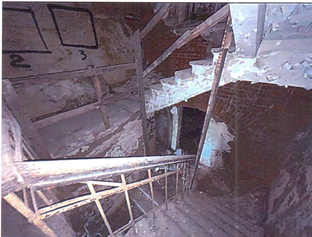
Фото 6. Лестница