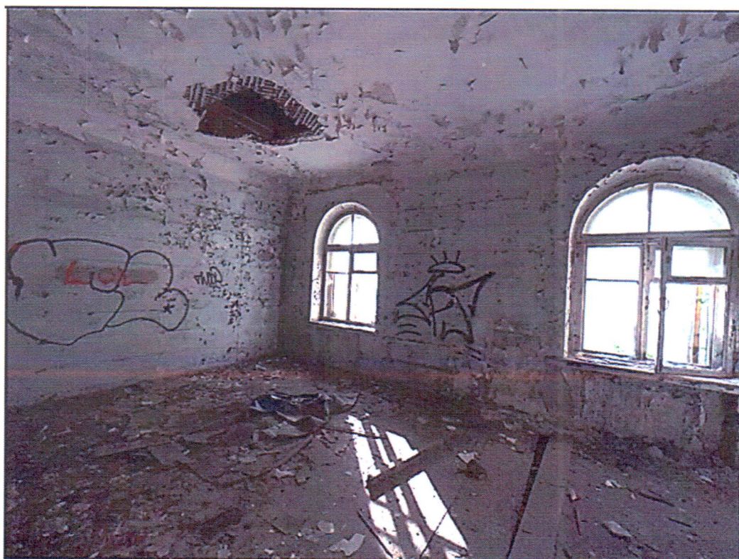
Фото 3. Помещения третьего этажа