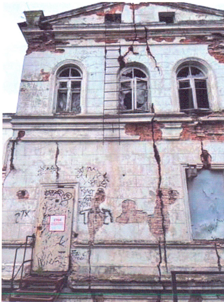
Фото 2 Фрагмент северного фасада